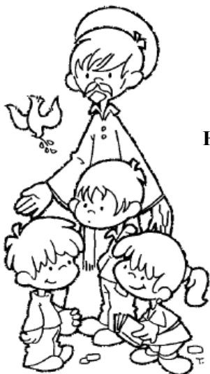
Św. Józef Kalasancusz

Drodzy Parafiadowicze! Przybywacie do Warszawy na zaproszenie Stowarzyszenia Parafiada im. św. Józefa Kalasancjusza. Stowarzyszenie jest jednym z dzieł Zakonu Pijarów. Wypada więc, byście wiedzieli, co to takiego pijarzy i z czym się to je.